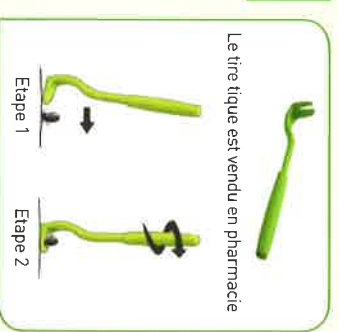
Le tire tique est vendu en pharmacie

• Consulter un médecin en cas d'apparition de symptômes tels que rougeur cutanée, maux de tête, fièvre et/ou douleurs dans les membres dans les jours ou semaines qui suivent la morsure de tique. Après diagnostic, il pourra vous prescrire un traitement adapté.